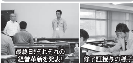
最終日それぞれの経営革新を発表!

「経営革新とは環境の変化に対応するため、経営ビジョンを明確にし、ビジネスを成功させるための環境を整備し、経営目標を実現させること。」 「経営革新とは環境の変化に対応するため、経営ビジョンを明確にし、ビジネスを成功させるための環境を整備し、経営目標を実現させること。」