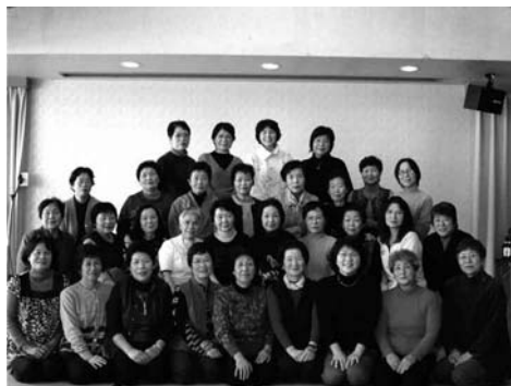
・今年も大勢が集いました新年互礼会

2月14日・15日、火の国熊本方面の視察・親睦を行いました。14日早朝、部員11名で沼田を出発。蓮華院誕生寺参拝の後に宝来宝来神社に移動。宝くじ当選祈願をしました。翌日、築城四〇〇年の歴史を刻む熊本城をガイド付でタックリ2時間かけて視察。復元された本丸御殿、宇土槽等の分かりやすい説明を受けました。セキアヒルズでは一変し、本格コースでのゴーカートスピード走行を体験しました。