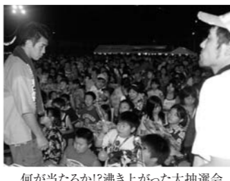
何が当たるか!?沸き上がった大抽選会

ら長蛇の列が出来、開会定刻、県民踊等踊りの会の皆様による炭坑節「盆踊り」が始まりました。今年も無事大会が終了しました。夏のコミューティの場としての盆踊大会は来場者の方々の笑顔で満たされました。今年の仮装大会のテーマは「チェンジ」。工夫を凝らした3チームが出場、ファイナレの大抽選会では立錐の余地もない櫓まわりとなり、沸き上がった余韻を残します。