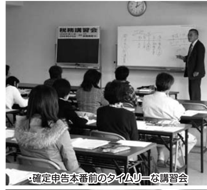
・確定申告本番前のタイムリーな講習会

20年分所得税、消費税の確定申告期限が目前に迫ってきました。確定申告はもう済みましたか? 所得税は3月16日(月)、消費税は3月31日(火)が申告納税期限となっております。商工会では側面的支援策として確定申告直前講習会を開催しました。