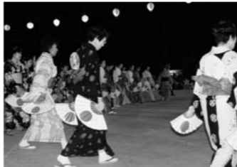
踊りの輪は涼しげな浴衣姿で彩られました