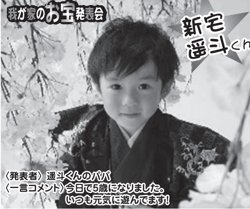
我が家のお王様発表会