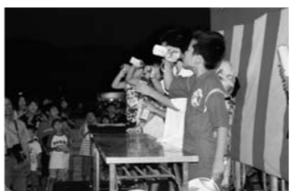
ラムネ早飲み大会…優勝は?