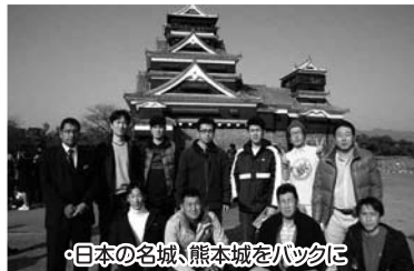
・日本の名城、熊本城をバックに

店舗演出、接客など商業機能が優れ、地域に親しまれている店舗を表彰する制度「いい店ひろしま顕彰事業」で四二〇店舗の応募の中から、川中醤油「醬の館」が堂々の優秀店舗に決定されました。消費者推薦によるエントリーを契機に関係者全員による創意・工夫・努力が結実し、見事難関を突破しての受賞となったものです。今後も「いい店」の名に恥じない店づくりを目指し一層の努力を続けま