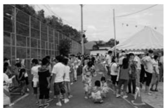
抽選用うちわに長蛇の列…