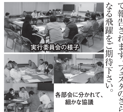
実行委員会の様子

日時 平成22年1月23日(土) 場所 湯来ロッジ 負担金 一人三千元 詳しくは後日御案内いたします。 ・10月18日(日)商工フェスタの女性部バザーコーナーでの収益金の一部を沼田町各学区社協へ寄付させていただきます。 ・11月17日(火)安佐地区女性部親善ビーチボール大会が開催され、沼田町からは2チームが参加しました。試合の度に、結束を深め好プレー、ハッスルプレーが随所にみられ、体育館では一進一退の白熱した試合が繰り広げられました。