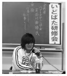
いどばた研修会 (H・M)

3月13日(金)福山ニューキャッスルホテルにおいて、臨時総会が開催され、議案総て、原案通り可決・承認されました。その後、業種ごとにテーブルを囲み、交流を兼ねて意見交換会を行いました。 (E・K)