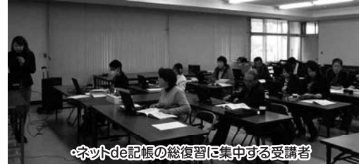
・ネットde記帳の総復習に集中する受講者

20年分所得税、消費税の確定申告期限が目前に迫ってきました。確定申告はもう済みましたか? 所得税は3月16日(月)、消費税は3月31日(火)が申告納税期限となっております。商工会では側面的支援策として確定申告直前講習会を開催しました。