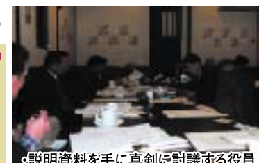
説明資料を手に真剣に討議する役員

◆20年最後の理事会を開催 年の瀬を迎えた12月5日午後三時より、わたや沼田店で理事会が開催されました。中間監査後の