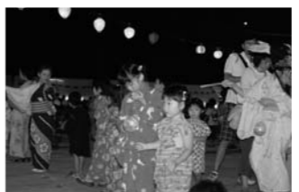
今夜は夜おそくても大丈夫?子どもたち…