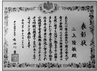
新年早々届いた表彰状

昨年開催された商工会全国大会において二上会長が中小企業庁長官表彰を受章されました。小規模事業者への振興に寄与された賜物です。おめでとうございます。