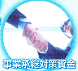
事業承継対策資金