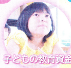
子どもの教育資金